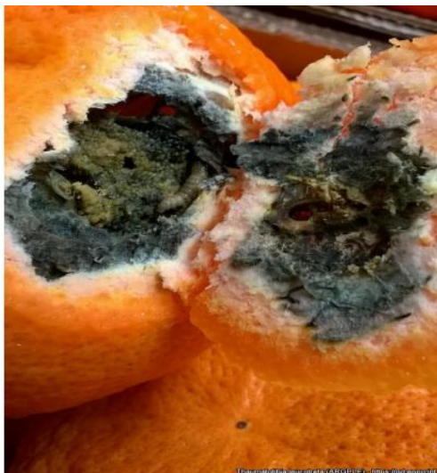
6 pav. Supuvęs apelsinas