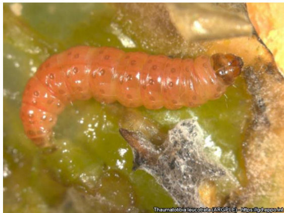
2 pav. Thaumatotibia leucotreta lerva