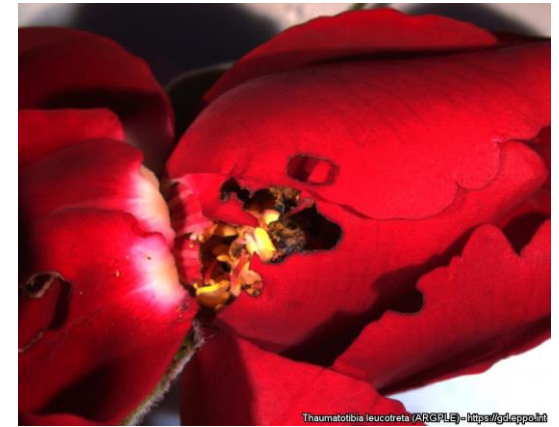
3 pav. T.leucotreta pažeista rožė

Pažeidimai atsiranda tuomet, kai iš kiaušinėlių išsivysčiusios lervos pragaužia mažas skylutes vaisiuose, sėklose bei žiedynuose, kad patektų į jų vidų (3 pav.). Čia jos minta ir bręsta. Aplink lervų suformuotas skylutes susidaro puviny (4 pav.) ir pažeista vieta patamsėja. Užkrėsti vaisiai pradeda pūti iš vidaus (5–6 pav.), anksti sunoksta ir nukrenta ant žemės.