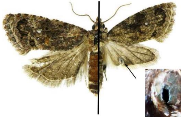
1 pav. Suaugėlio patelė (kairėje) ir patinėlis (dešinėje)

Kiaušinėliai yra 1 mm ilgio, gelsvi, vėlesnėse vystymosi stadijose tampa skaidrūs. Pilnai susiformavusios lervos yra 12–20 mm ilgio, galvutė tamsiai rudos arba juodos spalvos, o likęs kūnas dažniausiai rausvų atspalvių ir varijuoja nuo rožinės iki oranžinės spalvų (2 pav.).