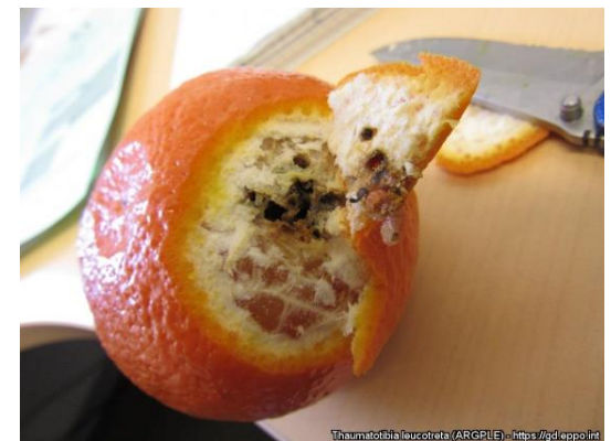
5 pav. Lervos apelsino viduje