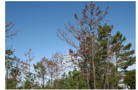
3 pav. Nematodais užkrėsti medžiai