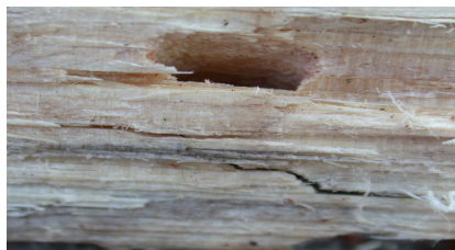
6 pav. Monochamus spp. veiklos požymiai