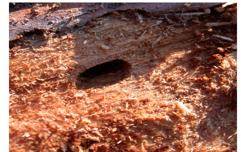
5 pav. Monochamus spp. veiklos požymiai