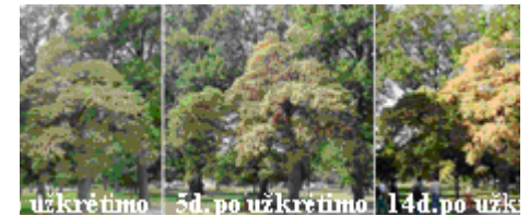
4 pav. Nematodais užkrėsti medžiai po 1 d., 5 d. ir 14 d.