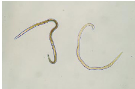
1 pav. Nematodas matomas per mikroskopą

Vabalas Monochamus spp. yra pagrindinis nematodo pernešėjas. Monochamus spp. vabalai (2 pav.) Lietuvoje nėra labai dažni, tačiau labai pavojingi miškų kenkėjai, kurių buvimas rodo ekstensyvų ūkininkavimą. Vabalų lervos gyvena po spygliuočių medžių (pušų, eglių) žieve ir medienoje. Vabalai apgraužia ūglius. Neretai puola ir sveikus medžius. Jų vystymasis trunka 2 metus.