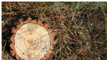
7 pav. Pamėlynavimai medienoje