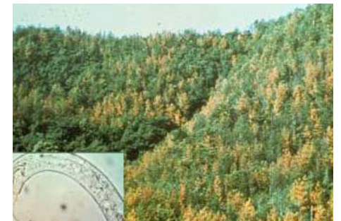
6 pav. Nematodais užkrėsti medžiai