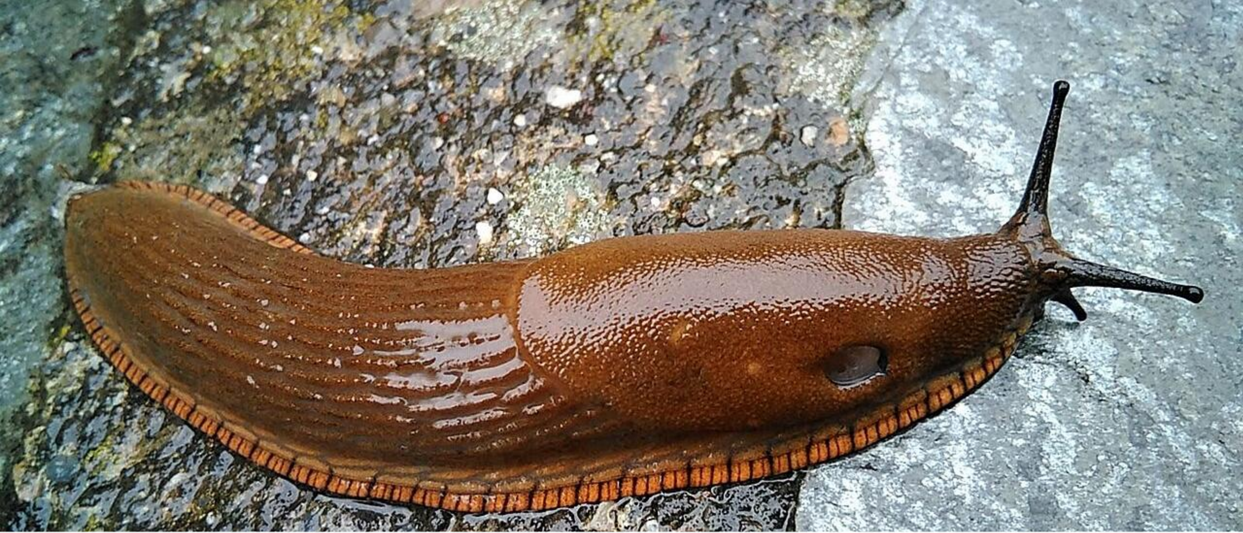
AAP (neprofesionaliam naudojimui) Ispaniniam arionui ( arion vulgaris ) naikinti