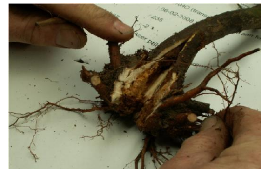
5 pav. Ardomasis mėginių ėmimo metodas.