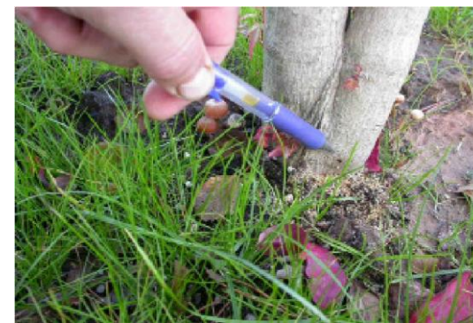
4 pav. Lervų padarytos medienos išgraužos.