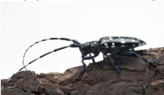
1 pav. Citrinmedinis ūsuotis Anoplophora chinensis (Forster).

Iki 2008 metų buvo priimta ir dokumentuose nurodomi du skirtingi kenkėjai: citrinmedinis ūsuotis ( Anoplophora chinensis Thomson) ir baltataškis ūsuotis ( Anoplophora malasiaca Forster). Plačiau ištyrus kenkėjus buvo pripažinta, kad tai yra tas pats kenkėjas ir pavadintas vienu vardu – citrinmedinis ūsuotis Anoplophora chinensis (Forster) (1 pav.).