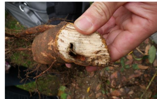
3 pav. Lervų padaryta skylė šaknyje.