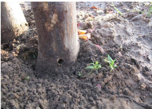
6 pav. Vabalų išskridimo skylė.

Kuo anksčiau kenkėjas yra nustatomas ir sunaikinamas, tuo mažesni nuostoliai patiriami. Kenkėjo aptikimą ir sunaikinimą apsunkina nevienodas kenkėjo vystymosi ciklas, kuris gali būti iki 3 metų, klimato sąlygos, užkrėstų medžių nuosavybės forma, želdinių statusas, pinigine ir nepinigine užkrėstų augalų vertė. Pažeisti medžiai dar kurį laiką žaliuoja, o vabalų suaugėlių padarytos skylės atsiveria tik vabalams palikus augalą šeiminingą (6 pav.)