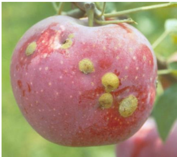
6 pav. Ant obuolio susiformavę pažeidimai