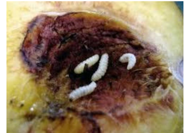
4 pav. Lervos obuolio viduje