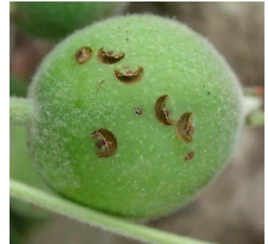
3 pav. Pusrėmens formos žymės

Suaugėliams mintant vaisiais, ant jų susiformuoja apvalūs 2–3 mm skersmens, rudai gelsvos spalvos, į randus panašūs pažeidimai (6 pav.).