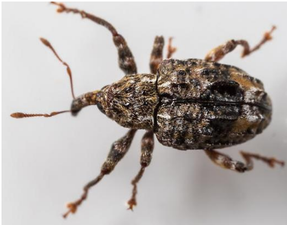
1 pav. Conotrachelus nenuphar suaugėlis

Lervos yra cilindro formos, 6–9 mm ilgio, bekojės, balkšvai gelsvos, su nedidele rudos spalvos galva. Lėliukės 5–7 mm ilgio, gelsvos.