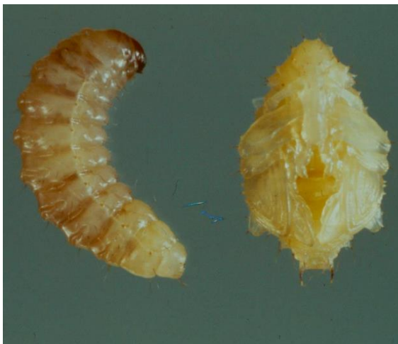
2 pav. Kenkėjo lerva (kairėje) ir lėliukė (dešinėje)