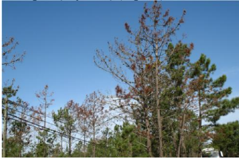
1 pav. Nematodu užkrėsta pušis

Portugalijoje 1999 m. pirmą kartą aptikti pušiniai stiebiniai nematodai ( Bursaphelenchus xylophilus (Steiner et Buhner) Nickle et al.) (toliau – nematodai). Tai 0,5–1 mm ilgio apvaliosios kirmėlės, kurios matomos tik per mikroskopą. Gausus nematodų skaičius užkemša maisto medžiagų tekėjimo takus ir taip sukelia pušų vytimą (1 pav.).