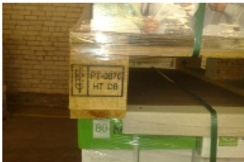
4 pav. Medinė pakavimo medžiaga po krovinių

Tokia MPM (4 ir 5 pav.) turi būti apdorota ir ženklinta pagal minėto standarto reikalavimus (HT ar DH).