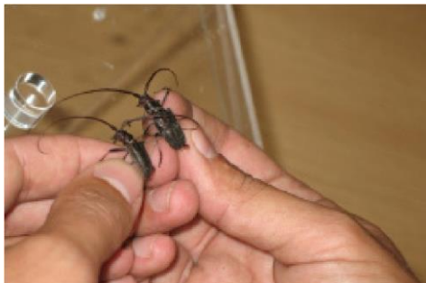
2 pav. Vabalas pernešėjas – Monochamus spp.

Natūralūs nematodų pernešėjai yra ūsuočiai vabalai ( Monochamus spp.) (2 pav.), kurie be žmogaus pagalbos plinta netolimu atstumu.