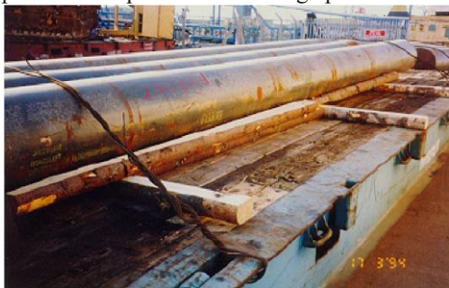
5 pav. Pagalbinė mediena po krovinių