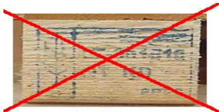
5 pav. Ženklas neįskaitomas.