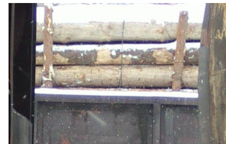
4 pav. Pagalbini spygliuočių mediena su spygliuočių medienos kroviniu

Pagalbinei medienai po tokios pat rūšies medienos kroviniu, taikomi tokie pat reikalavimai kaip ir importuojamai medienai!