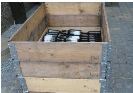
2 pav. Ženklinimas pagal ISPM 15.

MPM, naudojama pervežant bet kokios rūšies prekes iš trečiųjų šalių, išskyrus Šveicariją, turi atitikti ISPM 15 reikalavimus. Taip pat specialūs reikalavimai keliami į Europos Sąjungos šalis keliaujančiai MPM iš Portugalijos ir Ispanijos – MPM iš šių šalių privalo būti ženklinta ISPM 15 ženklu.