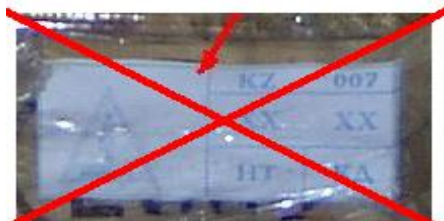
6 pav. Ženklas lengvai nuimamas – priklijuotas.