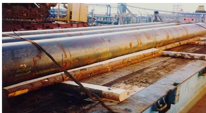
1 pav. Medinė pakavimo medžiaga po kroviniu.

4. MPM naudojama tokių krovinių gabenimui, kuriems paprastai nėra taikoma fitosanitarinė kontrolė.