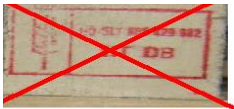
8 pav. Ženklas raudonos ar oranžinės spalvos.

Šalių, reikalaujančių, kad importuojama MPM atitiktų ISPM 15 reikalavimus, sąrašą rasite adresu http://www.ispm15.com