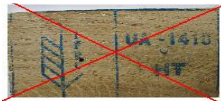
7 pav. Ženklas lengvai nuimamas – prikaltas.